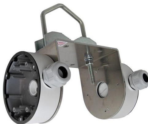
HIK134L + Z5V105 TWIN + 2x DS-1260ZJ