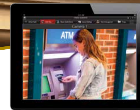
iVMS-5260HD Mobilní klient